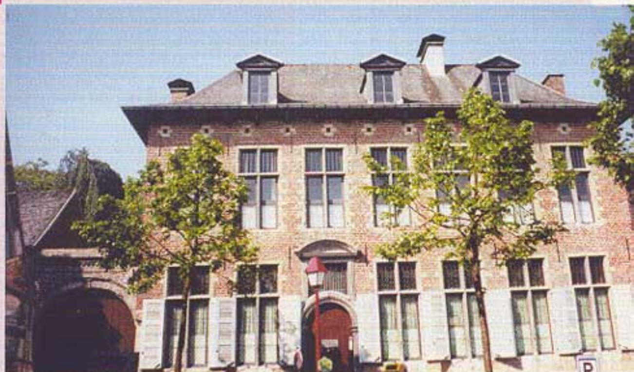
Oude notariswoning in Asse

Het officiële startpunt van deze omloop is uiteraard in Asse. Wij pikten voor onze eerste tocht van 2005 aan vanuit onze nabijgelegen biotoop en belandden zo in Affligem-Oost. Meteen het meest westelijke en tevens slechtste berijdbare stuk van de ganse route. Geen probleem want 2 kilometer verder worden de laatste klonters modder op de kasseien van „Varent“ van je fiets geschud. Wat daartussen ligt, is echter zonder meer mooi: de „oude baan“ volgt immers geasfalteerd de kam en je hebt een uniek golvend zicht aan beide zijden. Het donkere Kravaalbos aan de linkerkant domineert er de horizon. Je lijkt af te stevenen op het ranke kerktoentje van Asse-ter-heide, tot de route je met een bocht van 90° via hogervermelde kinderkoppen richting Asbeek rammelt. Deze Parijs-Roubaix toestand is van korte duur want je draait al even bruusk naar links, de „heilborre“straat in, die je op en neer naar Putberg voert. Hier gaat de vergelijking met de hel van het noorden pas echt op. Een vrij steile, zigzaggende, glibberige kassei brengt je zwetend door een donker bos rechts voorbij het kasteel Putberg (1882). Gelukkig sta je nu recht op je pedalen en zodoende ontgaat je ook het landgoed Borchstadt aan de overzijde niet. Een welgekomen adempauze. Blijkbaar staat het pand op de grondvesten van een Romeins kamp. Dat hoeft je niet te verwonderen want de oude Heirbaan lag ooit vlakbij.