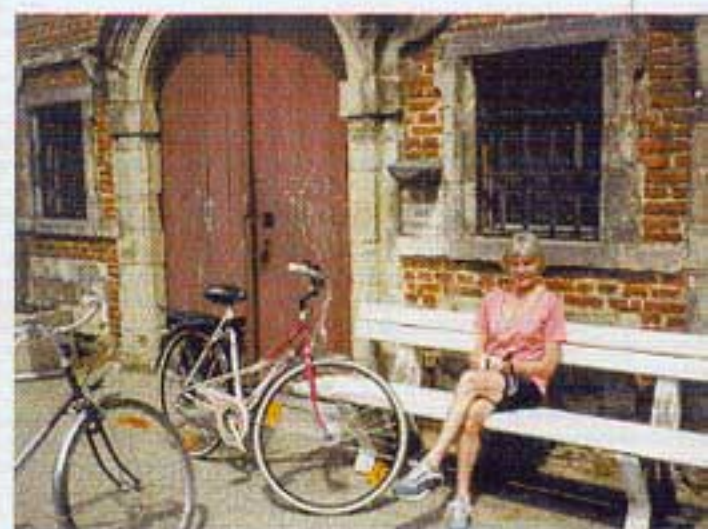
Uitblazen aan de St.-Annakapel

Maar nog niet helemaal: Een laatste klim – we zijn aan ons vertrekpunt - naar de Eksterenberg wordt uiteindelijk nog maar eens beloond met een glooiend Pajotten-én Faluintjeslandpanorama. Een attentvol neergepote bank die we voor de gelegenheid toedichten aan de 'Land van Asse' route, maakt de